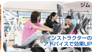
インストラクターの アドバイスで効果UP

つるおか・さかた 無料体験実施中 4/25→4/30まで お電話でのご予約を お願い致します。