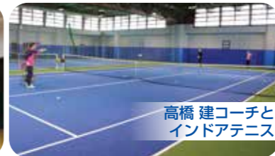
高橋 建コーチと インドアテニス