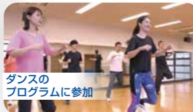
ダンスの プログラムに参加