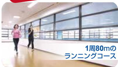
1周80mの ランニングコース

つるおか・さかた 無料体験実施中 4/25→4/30まで お電話でのご予約を お願い致します。